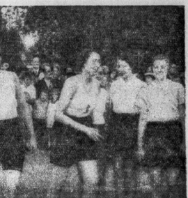
Freuen zeigen beim Schlagballwurf Kraft und Gewandheit