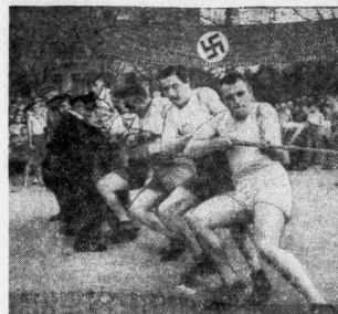
Das Tanzen auf dem Wettiner Platz