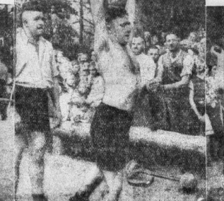
Beim Gewichtheben sah man erstaunlich starke Männer