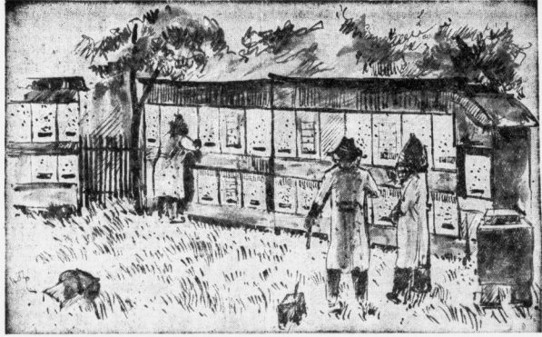
Der große Augenblick: Erster Schwarm in den Fenchel