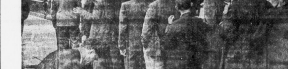
Die Regierung Laval hat bekanntlich eine Reihe von einschneidenden Sparverordnungen erlassen. Nun stehen die Pariser Einwohner vor der Aufgabe, sich an diese Verordnungen zu halten.

Frankreich ist im Zeichen der Notverordnungen. Die Regierung hat eine Reihe von Notverordnungen erlassen, um die öffentliche Ordnung zu gewährleisten. Diese Verordnungen betreffen unter anderem die Presse, die Versammlungen und die Bewegungsfreiheit.