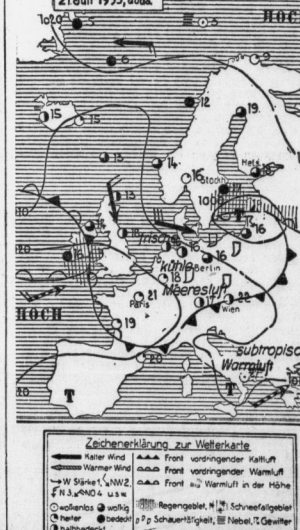
Zeichenerklärung zur Weltkarte

Aus 2600 Morgen Gesamtbau werden 50 Bauernstellen neu geschaffen. Die Domäne Schackenthal wird in 50 kleine Bauernstellen unterteilt.