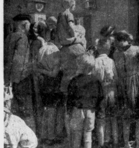
...aber was ist zu sehen, das möchten wir auch wissen; wahrscheinlich ein „zerwecktes“ Rad, das ist jetzt in Halle üblich