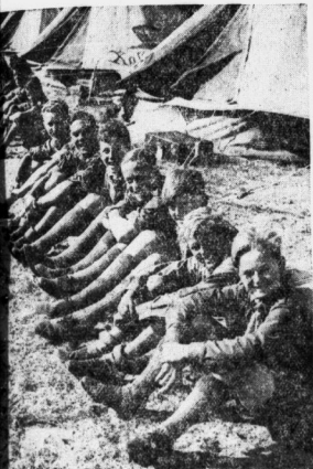
„Lagerleben“: Wiesener Hitler-Jugend schmückt ihr Zelt mit einer Zeichnung des „Stürmbecker“

Die Hitler-Jugend feiert in diesem Jahre ein Jubiläum das noch niemals in der Geschichte der deutschen Jugendbewegung vorgekommen ist: ein hundertjähriges Bestehen der Hitler-Jugend . Seit Monaten bereitet sie sich auf diesen Tag vor. Seit Monaten hat sie sich im Ausland bewegt, die Reichsjugendführung in mühevoller Kleinarbeit mit dem Aufbau eines deutschen Jugendvereins in jeder Hinsicht beschäftigt. Und es sind nicht nur die Mitglieder der Reichsjugendführung, die an diesem Tag teilnehmen, sondern auch alle europäischen Länder sind besucht. Die auslandsdeutschen Hitler-Jugend erzieher am letzen Abend an dem großen Erlebnis, das sie seit heute zu erleben haben.