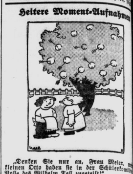
Denken Sie nur an, Frau Mils, wie klein dein Dito haben für die Schülter der kleinen Dito Wilhelm Teil angeht!

„Wohlgeliebt war, Mils, und dann warf sie sich zurück.“ ... „Er nahm ihre Hand in seine beiden Hände und sah sie in die Augen, die selbst am glänzendsten die Welt in sich schloß.“