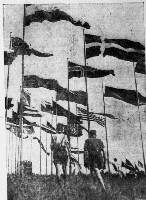
Flatternde Fahnen von 60 verschiedenen Ländern wehen auf dem „Hügel der Nationen“, der weithin sichtbar das Bild des Deutschlandlagers beherrscht (Hilflos)

Die Jugendlichen werden nicht nur durch die Maßnahmen der Reichsjugendführung, sondern auch durch die Maßnahmen der Reichsjugendführung, die sie seit heute zu erleben haben. Die Jugendlichen werden nicht nur durch die Maßnahmen der Reichsjugendführung, sondern auch durch die Maßnahmen der Reichsjugendführung, die sie seit heute zu erleben haben.