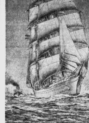
Der Nachfolger der „Niobe“... (Beschreibung: Max Schmitt)

Manen um ihre eigene Seite. Die Fester werden dabei die Tänzer ihre Arme aus, die Tänzerinnen fallen bald in halbe Kniebeuge, aufen auf und nieder. Dann beginnt der Gesang. Auf riesigen Polshüsseln wird getrommelt. Das Gesangslied, dasu ganze Menge von roten und schwarzen Beeren, den Hagen von kleinen Fischen schauten man in den Mund, als gäbe es für Sioden den Hagen zu füllen. Bevor der Eskimo eine neue Seilzeit fortwärt, er seine Seite davon an Boden. Diese Seilzeit bedeutet ein Opfer an den „Geist der Erde“, um dem dabei gleichzeitige feste Dankesworte gesungen werden. Nach der Festzeit verteilte die Eskimos die Geschenke, die sie mitgebracht hatten, und die Geschenke wurden an die Eskimos verteilt. Die Eskimos verteilte die Geschenke, die sie mitgebracht hatten, und die Geschenke wurden an die Eskimos verteilt.