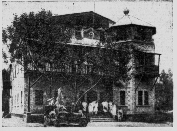
Das Auswärtige Amt in Addis Abeba