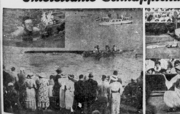
Ein feuchter „Zwischenfall“ bei Beginn der Meisterschaftsregatta der Ruderer am Sonntag gab es diesen kleinen „Zwischenfall“, der für die Beteiligten außer einem unfreiwilligen Bad selbstverständlich Folgen hatte. Bei Überbreitung des Blumenstraßens an den Steuermann der siegreichen Mannschaft kenterte das Boot und die Ruderer fielen ins Wasser. In der linken Ecke unseres Bildes: Einen Schandenspruch später schwamm der Steuermann, den man nicht hoch in der Hand haltend, und über den Zwischenfall herzlich lachend, an Land.