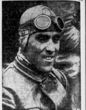
Nuvolari, der Sieger von Nürnberg...