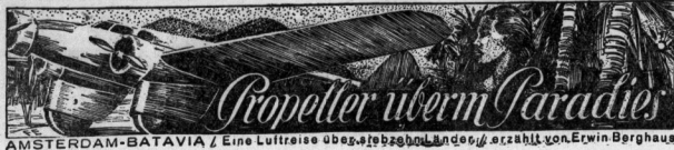
AMSTERDAM-BATAVIA / Eine Luftreise über... erzählt von Erwin Berghaus