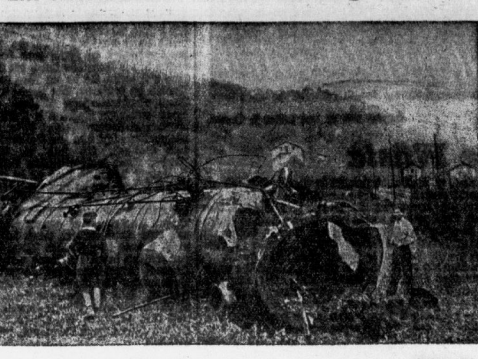
Das erste Bild von dem Eisenbahnunglück bei Tenay-Hautville in Frankreich, wo die Lokomotive des Schnellzuges Genf-Paris plötzlich explodierte...