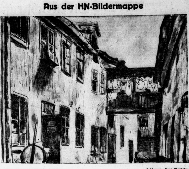
Alter Hof in der Kleinen Schloßgasse. Zeichnung: Kurt Harboß