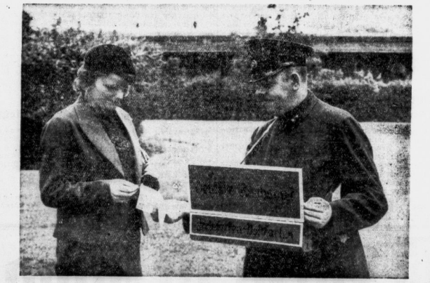
Zum Verkauf von Postwertzeichen und Postkarten hat die Deutsche Reichspost besonders, an einem Rollen zu tragende, postrot gestrichene Kästen beschafft, in denen die gangbarsten Wertzeichen auf Rollen und eine Reihe von Postkarten untergebracht sind. Unser Bild zeigt einen „fliegenden“ Briefmarken-Verkäufer der Deutschen Reichspost.