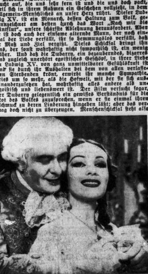
Dolores del Rio als „Madame Dubarry“ in dem gleichnamigen Film mit Reginald Owen...