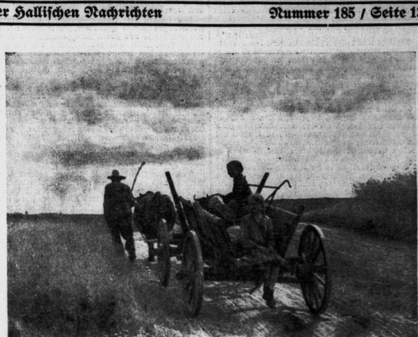
Fahrt in die Ernte