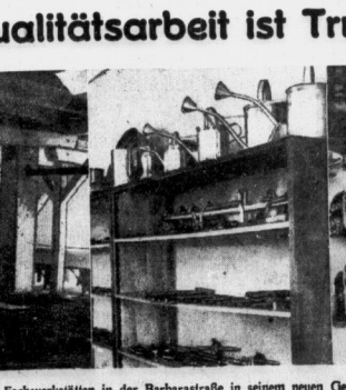
Von links nach rechts: Der große Eßsaal der Fachwerkstätten in der Barbarastrasse in seinem neuen Gewande; aus der Ausstellung der Qualitätsarbeiten in den Fachwerkstätten (vergl. obenstehenden Artikel); eine Tafelarbeit der Serviermeister bei der gestrigen Prüfung der Küchen- und Serviermeister (vgl. Bericht auf S. 6).

Die Besichtigung, deren Wiedererhalten nicht als ein wenig wichtiger Bestandteil der Arbeit angesehen werden kann, sondern als ein wichtiger Bestandteil der Arbeit angesehen werden kann. Die Besichtigung, deren Wiedererhalten nicht als ein wenig wichtiger Bestandteil der Arbeit angesehen werden kann, sondern als ein wichtiger Bestandteil der Arbeit angesehen werden kann.