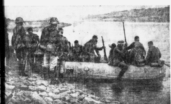
Infanterie geht in Schlauchbooten über die Elbe