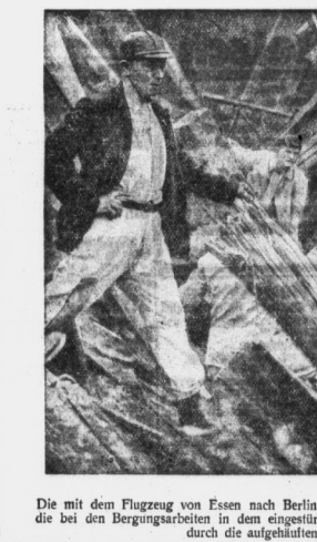
Die mit dem Flugzeug von Essen nach Berlin... (Caption text)

Die mit dem Flugzeug von Essen nach Berlin... (Text continues with details of the rescue operation)