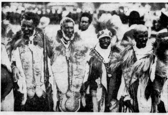
Abessinien ist ein christliches Land, und der Negus gibt sich alle Mühe, seine Untertanen nach abendlichen Gesichtspunkten zu zivilisieren...