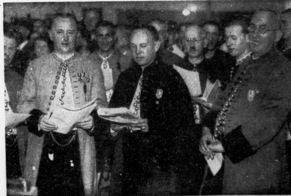
Einen heimischen Querschnitt durch den Industriegaub Halle-Merseburg bot die Sendung „Das Land der braunen Erde“ im Volkssender der 12. Großen Berliner Rundfunk-Ausstellung 1935.