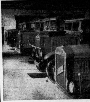
Der Aufmarsch der Kraftwagen

Betriebsmittel. Daneben sind dem nicht an Säulen gebundenen Kraftwagen noch andere wichtigere Aufgaben vorbehalten.