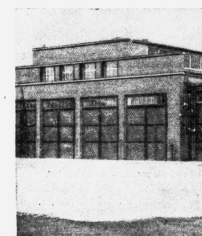
Das neue Kraftwagen-Betriebswerk.

Der Diemitzer Neubau ist das Muster einer modernen Kraftwagenanfertigung. In den Rängen wurden von 120 bis 130 Meter erreicht für den dreigeteilten Bau längs der Fernstraße 100 bis 110.