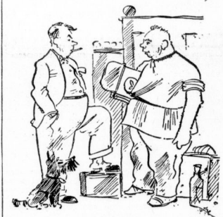
Originalzeichnungen von dort weiter... Das ist ja kein Hund, das ist ja kein Roller ist das!

Das ist ja kein Hund, das ist ja kein Roller ist das! Das ist ja kein Hund, das ist ja kein Roller ist das!