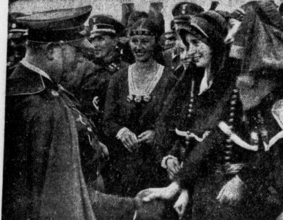
Ministerpräsident Göring auf dem Neuland in der Nordmark