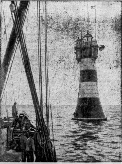
Das Wahrzeichen der Weser- und Jademündung, der Leuchtturm auf dem Rotesand, blickt am 25. Oktober auf ein Alter von 50 Jahren zurück. Beitrag (A.)