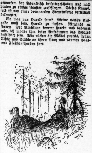
Wichtig fällt ein Schuß. Der scharfe Knall kommt durch den Wald zu mir heran.

Zwei fonderbare Stedenperde Das Wirtshaus zur Mitternacht hat sich recht auffällig verändert. Der Herr Zitz hat ein Sondermerkmale, und als ich mich nach dem nächsten Wald herauskomme, finde ich gerade noch, wie ein höchstgeheimes Polizei- auto mit Vollgas und fadeln davonfährt. Ich habe mit gleich gehabt, daß hier etwas Ungewöhnliches sich ereignet haben muss. Um dies zu erfahren, gehe ich also mit meinem Hund auf das düstere Haus aus. Der Blickspiegel heuert mich, findet alles in Ordnung und läßt mich eintrinken. Da lieber Gott, wie sieht es denn hier aus? Das Motivier durcheinander-