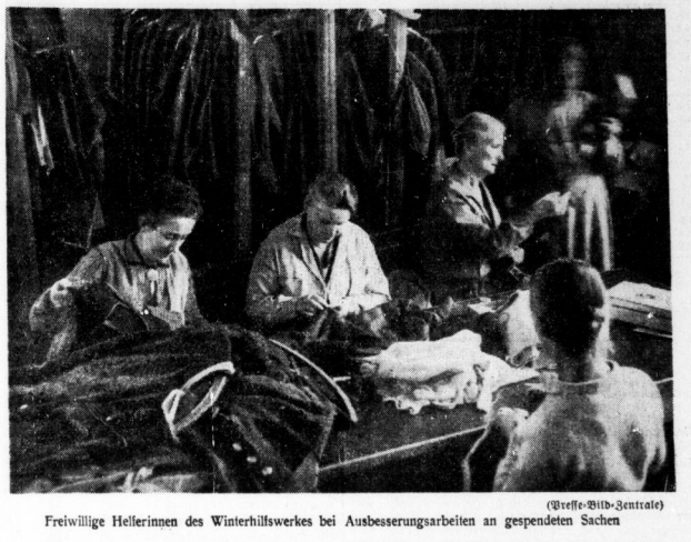
Freiwillige Helferinnen des Winterhilfswerkes bei Ausbesserungsarbeiten an gespendeten Sachen