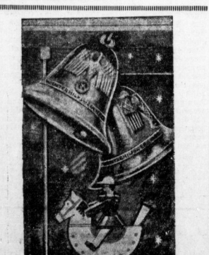
Die Türplatte des Winterhilfswerks für den Weihnachtsmonat