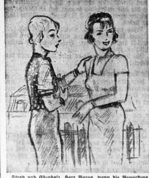
"Stroh und Ebenholz, Herr Baron, wenn die Bemerkung erlaubt wäre."

"Nichts, Herr -- oh, gemiß nicht! Lassen Sie mich fort von hier! Oh -- ich kann hier nicht -- mehr bleiben!"