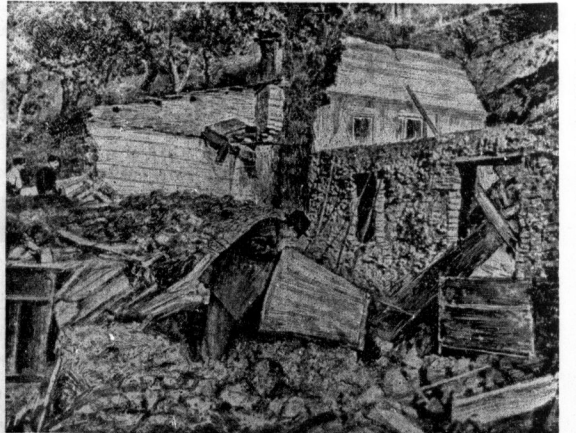
Sturmfluten und schwere, anhaltende Wolkenbrüche haben in vielen Provinzen Süditaliens verheerende Schäden angerichtet. Ganze Ortschaften sind von den Wasssermassen vernichtet worden, und nach den bisherigen Meldungen sind etwa 200 Tote zu beklagen. Auf unserem Bildergang sieht man die obdachten Bewohner des Ortes Cattansaro, die in den Trümmern ihres Hauses nach Habseligkeiten suchen.

viertel entstehen, die allen Grundfragen der Engländer und der Sozialpolitik Holz sprachen. Diese Zeiten des demagogischen Bauens, nur bestimmt von den Gewinnansprüchen der Unternehmer und Grundbesitzer, sind vorüber. Seit der Machübernahme durch den Nationalsozialismus ist zielführend die Sanierung der Reichsbauplanung von den schärfsten Auswüchsen früherer Zeiten auf dem Gebiet des Bauwesens in Angriff genommen worden. Der Führer hat der Staatskommission für die Hauptstadt Berlin beauftragt, Berlin zu der repräsentativsten Stadt des Reiches zu machen.