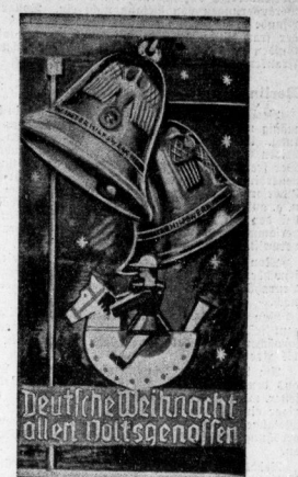
Die Türplakette des Winterhilfswerks für den Weihnachtsmonat

Der Fortschritte für den Handel beim Spielzeug sind im Vergleich mit dem Handel mit anderen Warenarten ein recht gutes Geschäft. Die Verteilung des gesamten Einzelhandelsumsatzes im Spielzeug auf die verschiedenen Vertriebswege stellt sich für 1934 aus folgender Übersicht (in Mill. RM):