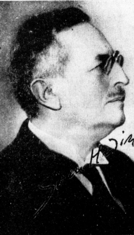
Der berühmte Weltreisende und Forscher Sven Hedin wird, wie wir hören, am kommenden Sonntag um 19 Uhr in Halle eintreffen...

Schlagen wir einmal die eine oder die andere Seite dieses Werkes auf, so finden wir hier das Spiegelbild dessen, was man Politischer Leiter nennt: Schöner, Reiner, Strenge, aber - furchtbar alle, die wir brauchen in Berufsleben finden, lösen hier ihre politische Aufgabe.