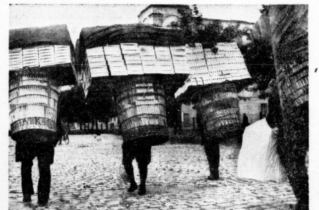
In mannsstarken Gepäckkaufbauten tragen die Heimarbeiter der Sonneberger Umgebung ihre Schachteln mit Spielzeug zu den Wiederverkäufern.