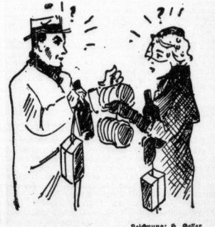
„Du hast auch Rollschinken...“

angenehm, ich will nun zuerst dort drüben lästeln. Diefe Überforderung! Die Schürchen eines Vorkühnens und eine geteerte Weinflasche bezeichnen mich über die Vorgänge des getragenen Abends. Dort auf dem Speiseltischen umfanden drei Weibchen mit roten schmalen Kaffees die Kaffee-maschine, eine elegante Gefäßdeckel stand angeordnet daneben. Ein Vater war von einer solchen Zusammenstellung begeistert gewesen und hätte sie ein dankbares Stilleben genannt.