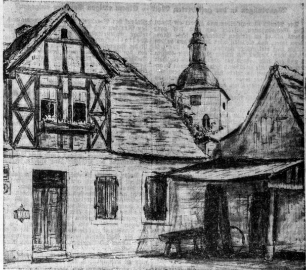
Motiv aus Korbetha - Zeichnung von Kurt Marholz