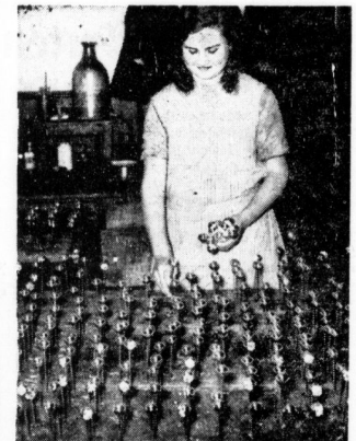
Christbaumspitzen werden mit Glöckchen versehen