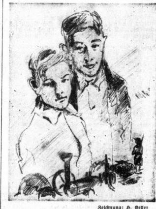
Der Blick ins Wintermärchen