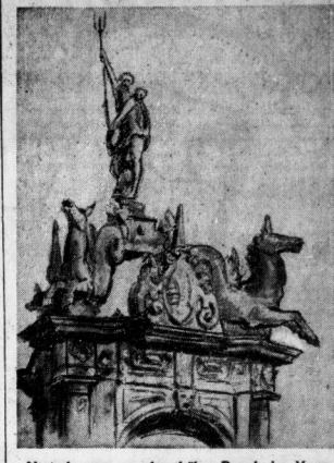
Neptunbrunnen aus dem frühen Barock im Merseburger Schloß - Zeichnung von Kurt Marlow