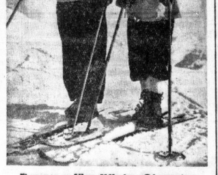
Training fürs Winter-Olympia

Der Oberbürgermeister erwarb das beinahe vollständige Dressierprogramm der Rurigen als Voraussetzung an der Olympischen Dressierprüfung teilnehmen wird. Der ausgescheidene westdeutsche Dressierreiter führt übrigens im Championatskampf mit 38 Siegen vor dem Berufsreiter H. Etzel mit 40 Erfolgen.