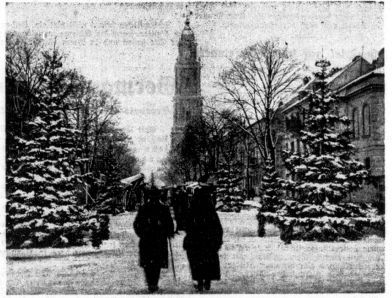
Weihnachtsmarkt auf historischem Boden: In Potsdam, zu Füßen der Garnisonkirche, ist für die vorlesentlichsten Tage eine bunte Budenstadt entstanden. Die historische Kulisse verleiht ihr einen besonderen Reiz.