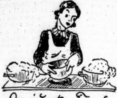
In junges Frau