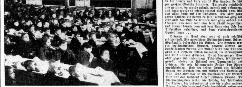
An langen, lichtergeschmückten Tafeln saßen in allen 34 Sälen erwartungsroh die Kleinen