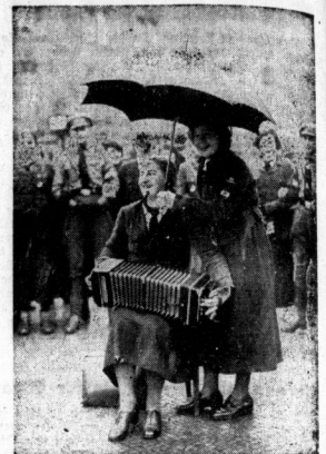
Der Goldene Sonntag in Berlin: Hitler-Jungen und BDM-Mädel bei lustigen Vorträgen am Potsdamer Platz im Rahmen der Straßensammlung für das WHT,