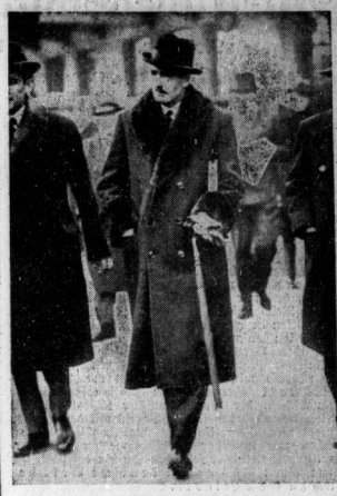
Außenminister Eden Eine der neuesten Aufnahmen Edens, die während der letzten Völkerbundssitzung in Genf gemacht wurde. Links

Waffen des Geistes Zu dem neuen Buch von Dr. Goebbels