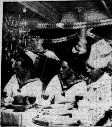
Weihnachten auf See: In der Mannschaftsmesse gibt das Schiffsorchester nach am Weihnachtsabend den Ton an.