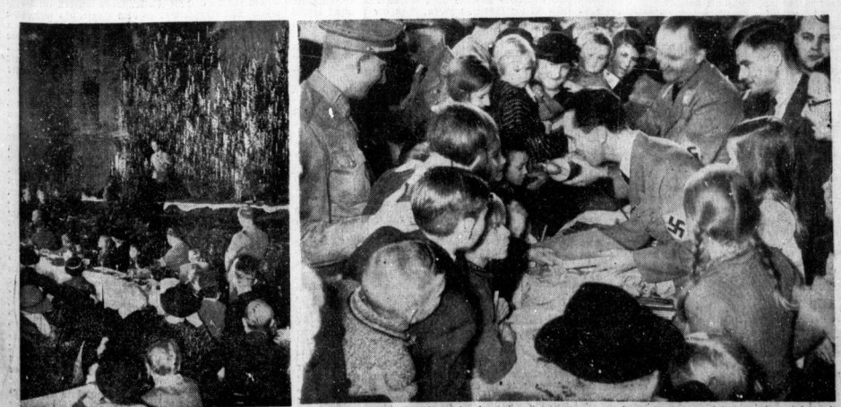
Reichsminister Dr. Goebbels sprach zu Millionen Kindern. Bild rechts zeigt Dr. Goebbels bei der Weihnachtsfeier im Saalbau Friedrichshain. Bild links: Dr. Goebbels spricht von der Bühne im Saalbau Friedrichshain.