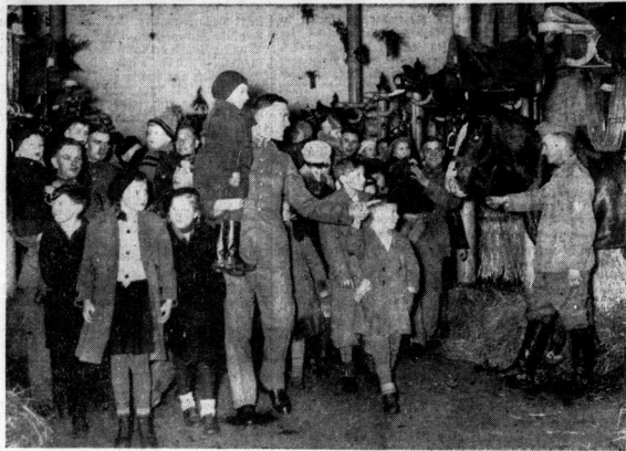
Eine große Weihnachtsfeier bereiten in Berlin die Mannschaften des Militärlichen Unterpersonals des Oberbefehlshabers des Heeres bedürftigen Kindern. Unser Bild zeigt die Kinder beim Rundgang durch die Stille. Die Kleinen dürfen nach der Feier sogar kleine Ritte wagen.