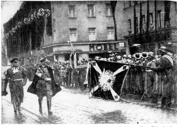
Der Führer beim Spatenstich zum Baugehen der Münchener Untergrundbahn. Unser Bild zeigt ihn beim Abschneiden der Ehrenformationen. Links neben dem Führer General der Flieger Sperle.