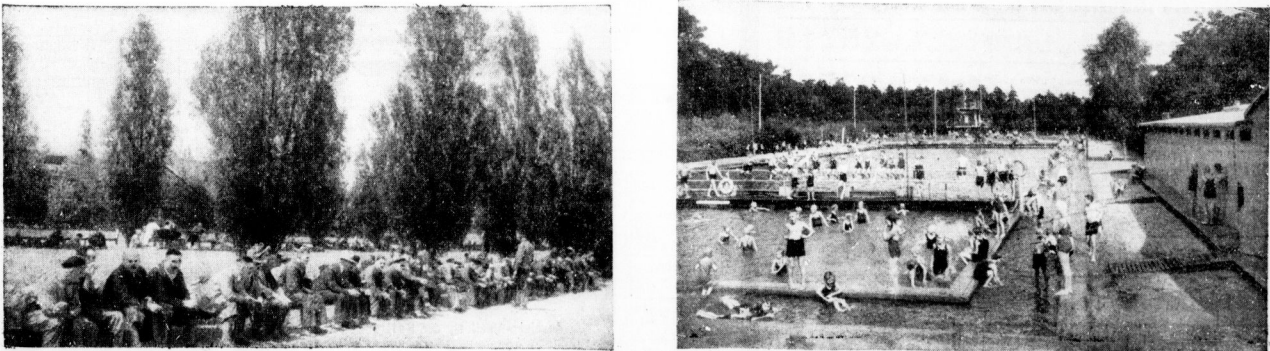
Die „Raucherwiese“ des Leunawerkes