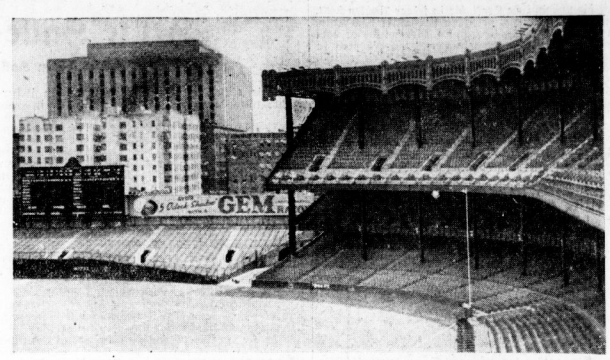
Hier steigt heute der Weltmeisterschaftskampf: Die riesigen Tribünen des Yankee-Stadions in New York.