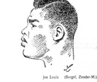
Joe Louis