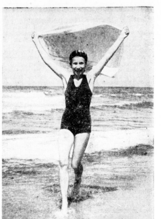
Die verkörperte Lebensfreude. Heiteres Bild aus dem Ferien-Sport-Zeiger des BDM in Ostseebad Henkenlagen.

Was soll es sein? Grünshnabel knüttelt die Schultern und wirft einen bebauernden Blick zu Mir.