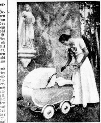
Frau Emmy Göring und ihr Töchterchen Edda