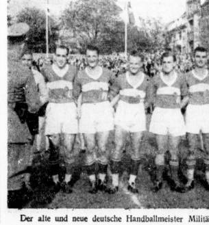
Der alte und neue deutsche Handballmeister Militär-Turn- und Sportabteilung Leipzig