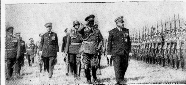
Auf dem Berliner Militärflughafen Staaken traf der Generalstab der französischen Luftwaffe, General Vallerin, zum Besuch der Standorte der deutschen Luftwaffe und Einrichtungen der Luftfahrtindustrie ein.