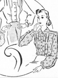
Die neue Bluse in hellblau... Schnitt B 2385