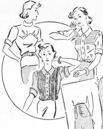
Jumberbluse aus persischblauem Stoff... Schnitt B 2345