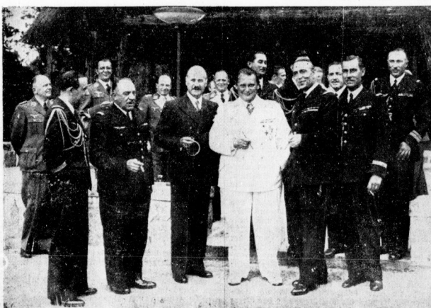
General Vuillemin bei Generalleutnant Göring in Karinhall. Links neben Göring der französische Botschafter Francois-Poncet und General Vuillemin, rechts neben Göring General d'Astier.

General Vuillemin bei Generalleutnant Göring in Karinhall.