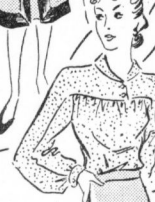
Die neue Bluse in hellblau... Schnitt B 2385