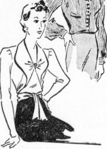
Elegante feine Oberhemdbluse mit umschlungenen Ärmel... Schnitt B 2384