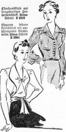
Oberhemdbluse aus feinstem Stoff... Schnitt B 2322