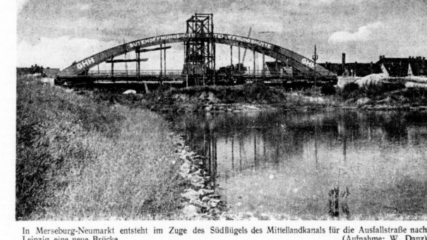
In Merseburg-Neumarkt entsteht im Zuge des Südluges des Mittellandkanals für die Ausfallstraße nach Leipzig eine neue Brücke