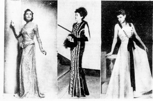
Links und rechts Modelle der Meisterschule für Mode in München, in der Mitte ein Modell der Modeschule Plauen. Das Kleid links ist aus neuartigem Goldreife mit Tüllspitze, rechts ein Abendkleid aus weißem Tüll mit aufgedruckten Goldsternen.

Am Montag zwischen 16 und 17 Uhr ging über dem Lahnbecken ein schweres Unwetter mit wolkenbruchartigem Regen nieder. Zielgenau hand das Wasser in den Dorfstrecken so hoch, daß es in die Gasse und Keller eindrang. In der Nähe von Warbenheim an der Bahnstraße Gleichen-Wehlar schwebten die von den Höhen niederfließenden Wassermaßen große Mengen von Erde und Sand auf der Bahndämme, so daß der Gleichenverkehr auf der Strecke Gleichen-Wehlar unterbrochen wurde. Alle Pässe von Frankfurt a. M. über Gleichen in Richtung Siegenland und Köln werden von Gleichen aus unterbrochen.