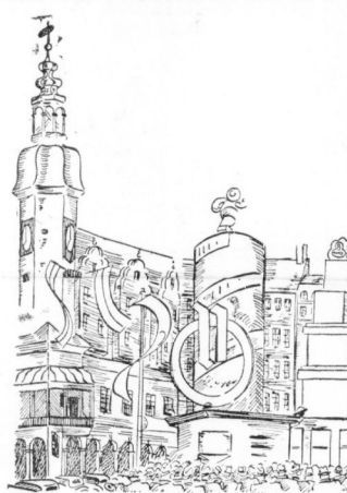
Das Messerzeilen am alten Leipziger Rathaus

Um den Verbraucher mit den neuen Werkstoffen bekannt zu machen, sind auf der Herbstmesse zwei lehrreiche Sonderausstellungen angeordnet worden, eine Kollektivausstellung des Großhandels und eine Beispielschau „Normale Erzeugnisse aus neuen Werkstoffen“.