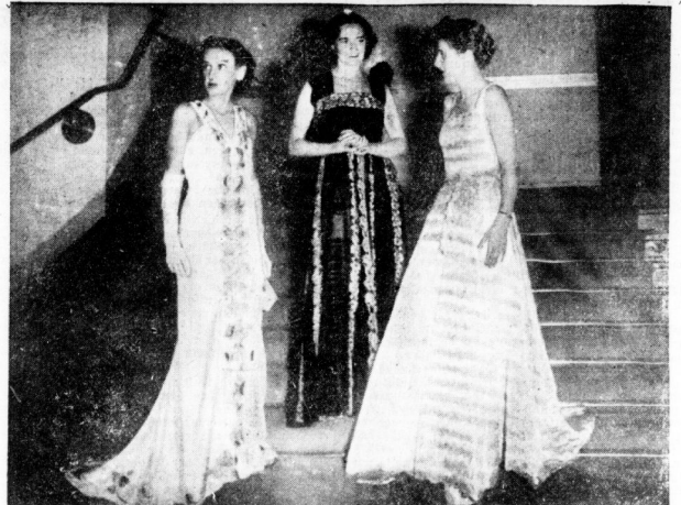
Modelle des Reichsinnungsverbandes des Damenschneiderhandwerks. In der Mitte schwarzes Tüllabendkleid auf schwarzem Taftunterkleid mit roter und silberner Stickerei.

sehen in der Markenpartie etwas hoch. Für Tadel bei der Gürtelpartie ist jedoch nichts zu sagen, da die Gürtel erfreulich stark betonen. Speziell über die führenden Modelle der diesjährigen deutschen Mode. Es konnte so aussehen, als handelte es sich doch nur um sehr teure Dinge. Inoffiziell ist es bei diesen Modellen ja nur darum, die Richtung anzudeuten, in der sich die Mode des Herbstes und Winters bewegen wird. Die außerordentliche Mannigfaltigkeit an Stoffen und Farben und auch die großen preiswürdigen Unterschiede bei den neuen Stoffen erlauben es dem einzelnen durchaus, sich modisch zu kleiden und dabei seinen Geldbeutel nicht zu überanstrengen.