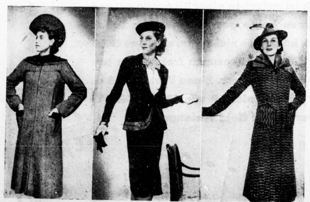
Neuartige Mäntel und ein Kostüm mit der neuen Modellierung. Der Mantel links ist aus braun-beigen Stichelhaarwollstoff, das Kostüm aus marine Kunstseidenkreppstirn, der Mantel rechts aus stark gezeichnetem Wollstoff, weinrot mit schwarz, gelblich.

gerichtet oder in loser Form, teilweise mit durchgehendem Reibverschluss, für den Vormittag aus veredelm Stoffen oder Sammetstoff, für den Nachmittag aus schwarzem weichen Stoff. Was die Farben der diesjährigen Herbstmode allgemein anbelangt, so sind sie wieder zarter und feiner geworden. Im Vordergrund steht das Farbenspiel der herrlichen Natur mit grün und braun. Daran sieht man aber auch ein helles Gelblich und kaltes Tiefblau, auch graue Töne, dagegen selten violette Farben. Schließlich noch ein Wort über die Weile. Man unterrichtet sowohl für den langen Mantel wie für den Paletot die weite und die gefaltete Form. Der gefaltete Kermel ist genau so modern wie der weitfallende, am Handgelenk enggenommene. Die Krage