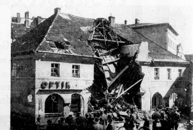
Ein Haus am Roßmarkt in Glatz, das durch die Hochwasserkatastrophe teilweise eingestürzt ist.