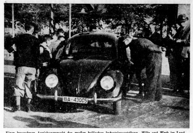
Einen besonderen Anziehungspunkt der großen hallischen Industrieausstellung...