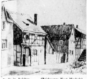
Straße in Auleben. (Zeichnung: Kurt Marholz)