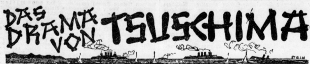
Von General A. A. Noskoff Copyright by Vorhut Verlag, Otto Schlegel, Berlin SW 68