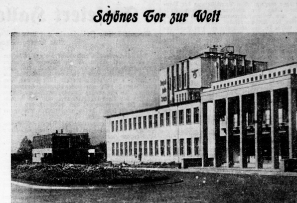
Das neue Verwaltungsgebäude des Flughafens Halle-Leipzig, über dessen Winterflugplan wir auf Seite 6 unserer heutigen Ausgabe berichten; im Bilde links die Flughafen-Gaststätte.