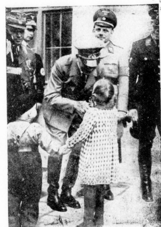
Schwester und Bruder, die unbedingt dem Führer die Hand geben wollten. (Schirner)