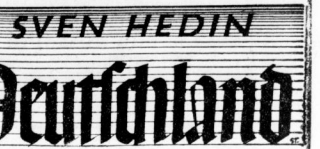
SVEN HEDIN