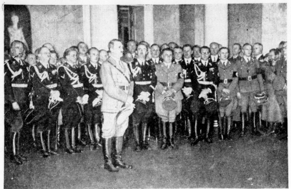
Der Empfang des Führers im Festsaal des Weimarer Schlosses während der thüringischen Gattage.

In Anerkennung der Verdienste Fildners wurde ihm befähigt auch eine Reihe Ehrungen zuteil. So ist er deutscher Nationalpremier für die Jahre 1937 und 1938. Er ist Ehrenmitglied der Kaiserlichen Akademie der Wissenschaften. Er ist Ehrenmitglied der Technischen Hochschule München. Dr. Wilhelm Fildner wird, bevor er die Heimat wieder verläßt, am 13. November von sich selbst, von seinen Schülern und seinen Erbsen feiern. Wenn er dann wieder draußen ist in den Sandhürnen der Gobi und seine Apparate zerbricht, so wird er vielleicht mit Hindernissen verbunden sein, werden ihm sehr wohl über ihn mit doppelter Anteilnahme mitleiden.