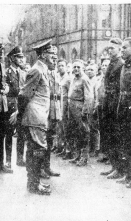
Der Führer mit den Lehrlingen der Wilhelm-Gustloff-Stiftung.