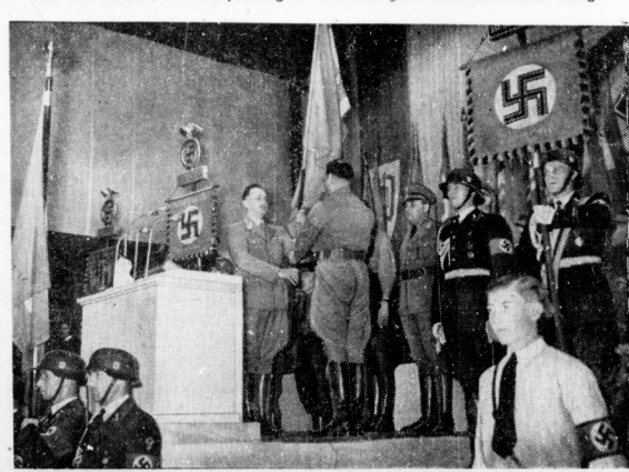
Konrad Henlein übergibt Rudolf Heß bei der Uebernahme des Sudetengaus in Reichenberg die Fahne der SdP.