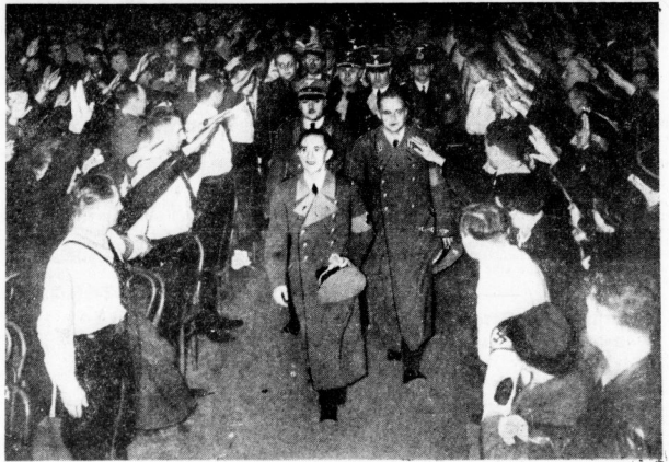
Reichsminister Dr. Goebbels bei der Eröffnung des Wahlkampfes im Sudetenland in der Reichenberger Messehalle. Hinter dem Reichsminister Gauleiter Henlein.

Das alles klingt viel aufregender, als es in Wirklichkeit ist. Nach menschlichen Ermessen kann auf der Vitoronca nichts passieren. Man kann mehr verfangen, noch verbrühen, noch wird man von Beduinen in flatternden Burauinen überfallen. Meist ein Wagen liegen, so wird er bald von einem Posten oder einem anderen Reisenden bemerkt und die nächste Station, die mit allem versehen ist, wird benachrichtigt. Und Beduinenüberfälle gibt es nicht, weil, wie mir ein Beamter sagte, Libyen sicherer ist