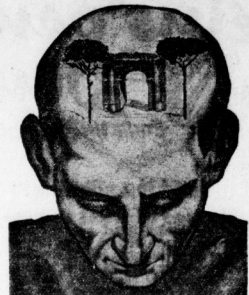
Ein Foto aus der alten Glazer gemalte Landschaftsbild den alten Römern als Schönheitsideal