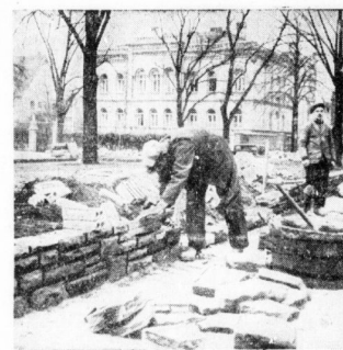
Die Neuanlage hinter der Christian-Thomasius-Schule wird mit Porphyresteinen eingetast.