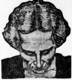
Dr. Goebbels mit Zopf