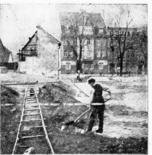
Erdarbeiten zum Kinderspielplatz an den Weingärten

des Viertels. Ein paar Bäume wachsen auf ihm, aber sonst besteht es aus grauem Sand und holprigen Erdhügeln. Das harte Gefälle, das er nach Westen hin aufweist, schien ihn für eine gärtnerische Ausgestaltung ungeeignet zu machen.