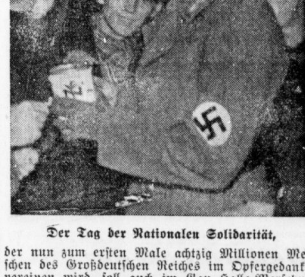
Der Tag der Nationalen Solidarität, der nun zum ersten Male achtzig Millionen Menschen der Völkerründen Reiches im Opfergedanken vereinen wird...

Das WHW. 1938 muß der geschichtlichen Größe dieses Jahres entsprechen! Denkt auch am kommenden Sonntagabend an diese Worte des Führers!