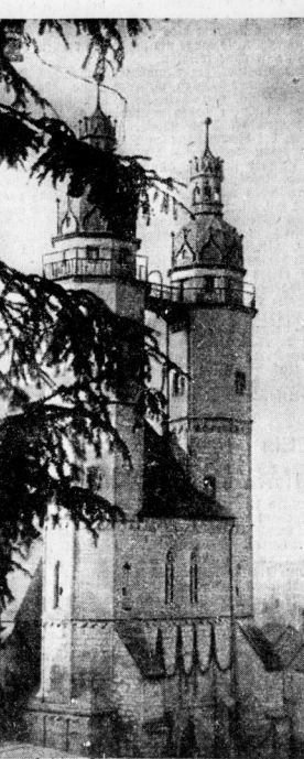
Unser Bild zeigt einen nicht alltäglichen Blick vom Dach eines großen Geschäftshauses an Marienkirche.