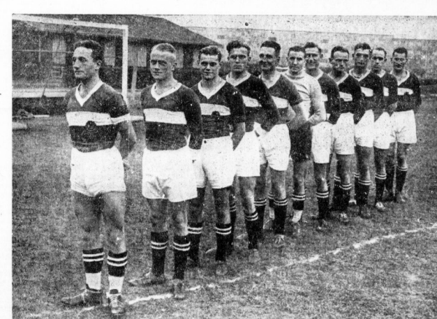
Die Handballmannschaft der MTS A. R. 1 Leipzig, die in diesem Jahr in der Mitteldeutschen Kampfbahn in Halle mit 6:5 die deutsche Meisterschaft gegen den M. V. 1. R. 53 Weiskreis gewann...

1:10,7, aufgestellt am 29. Oktober in Hannover und über die gleiche Straße 1:06,5 am 13. November in Bremen. Diese Zeit ist noch Rekordzeit.