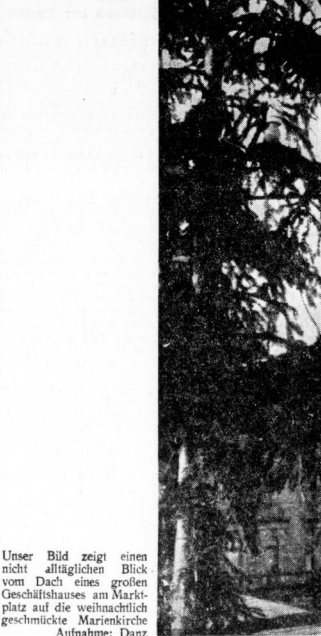
Unser Bild zeigt einen nicht alltäglichen Blick vom Dach eines großen Geschäftshauses an Marienkirche.