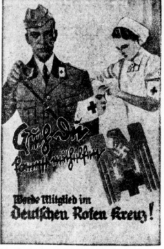
Hier Mitglied im Deutschen Roten Kreuz!