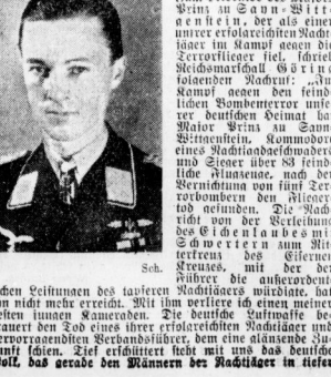
Die Welt, 26. Jan. In der Wochenschrift, die sowjetischen Nachrichten und die Propagandaforschung Moskaus dem britischen Radio als „bedeutende Beiträge des Bundesgenossen“ zu bringen, hat der britische Nachrichtenendienst ein Schreiben von großer politischer Bedeutung veröffentlicht, indem er jetzt anzeigt, daß der Nachrichtenendienst von Sowjetland im Januar 1939 nur aus dem Grunde geschlossen worden sei, um für einen fest beschlossenen Generalangriff auf Deutschland im Herbst des Jahres 1939-40 vorbereitete „Mittel“ für einen Angriff auf Deutschland im Herbst des Jahres 1939-40 zu erhalten.