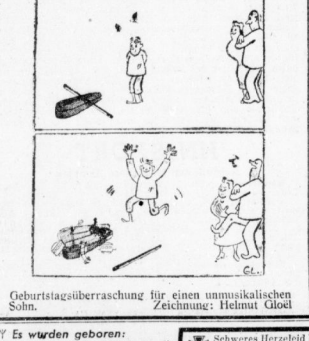
Geburtsüberschätzung für einen unmisskalkulierten