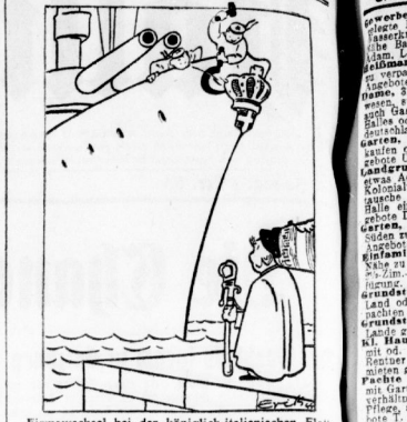
Firmenwechsel bei der königlich-sächsischen Flottille. Zeichnung Erik Schöner

Die neue Buch von Reinhold Zitel. In der ersten Hälfte des 19. Jahrhunderts, als er an der Wiener Oper seinen ersten und größten Erfolg erlebte, er einen unheimlichen Erfolg aus der mittelmäßigen Gestalt der Opernrollen heraus. Der Mann, der aus einer kleinen Gestalt einen großen Mann machte, der aus einer kleinen Gestalt einen großen Mann machte, der aus einer kleinen Gestalt einen großen Mann machte.