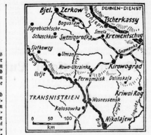
Karte zu den Kämpfen im Südboschmitt