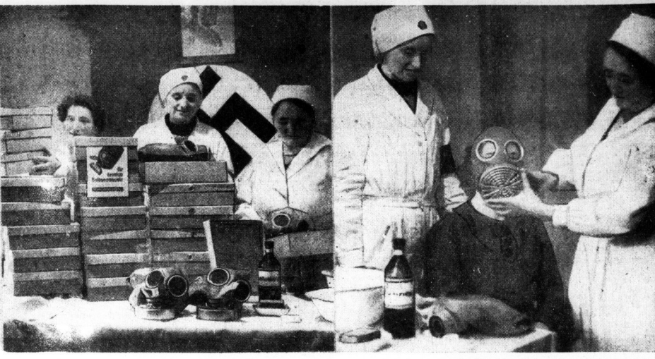
Ein Blick in eine der Ausgabestellen. — Ortsgruppe Hallmarkt