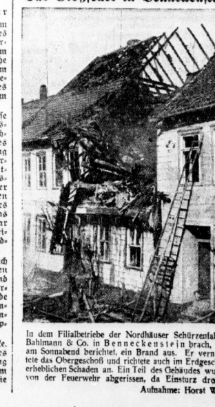
In dem Filmbeitrag der Nordhäuser Schürzenfabrik Bahnmass & Co. in Bennedekstein ist der Verlauf eines Sonnabendberichts, ein Brand aus dem verheerenden Schaden an den Gebäuden wurde von der Feuerwehr abgeräumt, da Einsturz drohte.