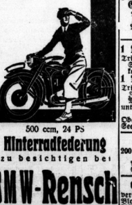
BMW-Rensch. Adoff-Hitler-Ring 4