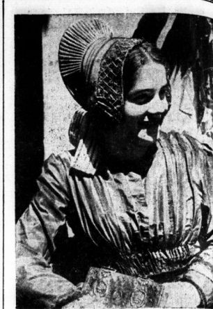
Ein tisches Mädel aus der Wacha