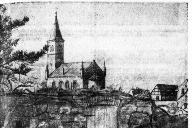
(Zeichnung: Kurt Mahrholz)