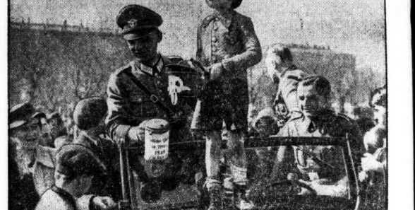
Die deutsche Ordnungspolizei veranstaltete am Sonntag auf dem Heidenplatz in Wien eine Geldsammlung zugunsten der Armen Wiens. — Ein kleiner Wiener Junge hilt der Polizei beim Sammeln.

andern an dem Weisheit aufgerufen wurde, mit dem er sein neues Leben beginnen sollte. Von der Corinthenstadt steigt man hinunter zu der Villa, die in der Ebene liegt. Die Villa ist ein herrliches Beispiel der Anlage, mit mehreren Wärdern, einem schönen Forum, einer langen Säulenhalle und selbstverständlich auch einem herrlichen Garten. Die Villa ist ein herrliches Beispiel der Anlage, mit mehreren Wärdern, einem schönen Forum, einer langen Säulenhalle und selbstverständlich auch einem herrlichen Garten. Die deutsche Ordnungspolizei veranstaltete am Sonntag auf dem Heidenplatz in Wien eine Geldsammlung zugunsten der Armen Wiens. — Ein kleiner Wiener Junge hilt der Polizei beim Sammeln.