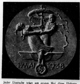
Jeder Deutsche trägt am ersten Mai diese Plakette. Lebensreife ist der Ausdruck der von Prof. Klein, München, zum 1. Mai geschallenen Plakette.

* Zu den Beförderungen. In dem Lebenslauf, dem wir gestern von Generalmajor Schmidt veröffentlichten, muß es heißen, daß Generalmajor Schmidt 1929 in die Inspektion der Infanterie im Reichswachtministerium versetzt wurde.