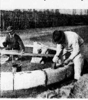
Die drei aufnahmen zeigen die Entstehung des Brunnens bis zur Aufstellung der Brunnenfigur. — (Aufnahmen: Danz und Ziegler).