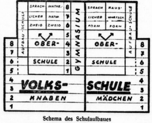
Schema des Schulbaues