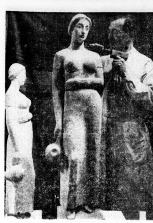
Der Schaugarten des Südparks ist dieser Tage um einen schönen Schmuck, einen Brunnen, bereichert worden. Die Plastik stammt von Bildhauer Gerhard Geyer; sie stellt eine Wasserträgerin dar. Als Material wurde Freyburger Muschelkalk verwendet. Die drei aufnahmen zeigen die Entstehung des Brunnens bis zur Aufstellung der Brunnenfigur.