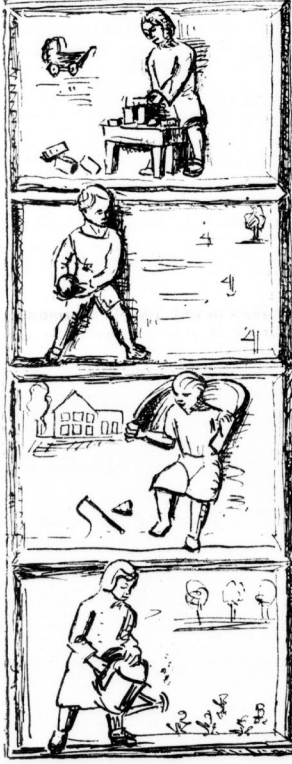
Die Keramikreliefs an der Schule in Roitzsch (K. Marholz) Säulen gefesselt, worauf nicht nur der Ortsherr, sondern auch die Kräfte der großen, über 4000 Ein- wohner zählenden Dorfgemeinde. Dieser Zieb-

Unter den Strenghöfemörtern nimmt Roitzsch auch seine eigene Niederfahrt, seinen großartigen Schulbau und durch die Gauschule der D.N., eine be- sondere Stellung ein. Einmal hatten in Roitzsch die