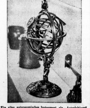
Ein alles astronomisches Instrument, ein „Astrolabium“ aus dem 14. Jahrhundert, welches aus einem deutschen Museum entliehen wurde und auf der Internationalen Handwerkschau zu sehen sein wird.