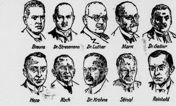
Das gestern in Aussicht genommene Reichstagsmitglied der Mitte, das wieder gewählt zu sein scheint.